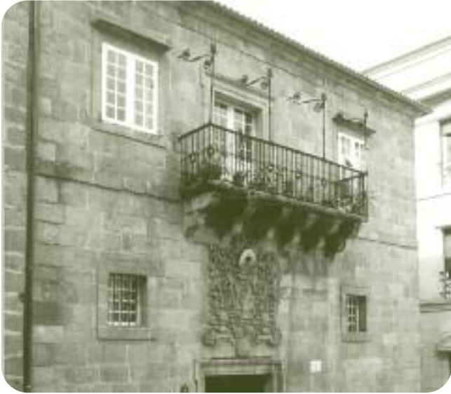
FACHADA DO EDIFICIO Á PRAZA MAIOR