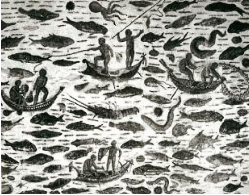
HADRUMETUM. MOSAICO DO HIPOXEO DE HERMES

Os lastres, procedentes do conxunto arqueolóxico-natural de Santomé, foron documentados na croa do castro, no interior dunha construción de esquinas redondeadas, correspondente á primeira fase de ocupación do asentamento castrexo, que se mantivo en uso ata o abandono do castro a mediados do século II d. C. O feito de que apareceran na primeira capa, entre o derrubo pétreo, pode deberse a que a rede da que formaban parte puido estar pendurada dunha das paredes, e non apoiada sobre o pavimento de uso da vivenda.