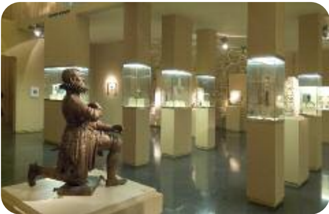
ESCOLMA DE ESCULTURA, SALA SAN FRANCISCO