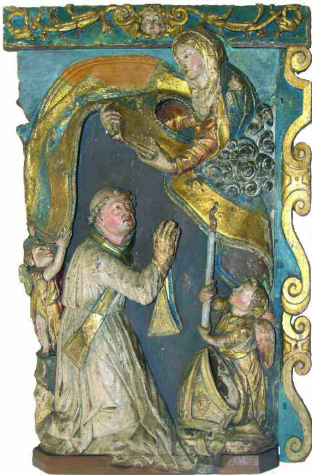
O RELEVO ANTES DA RESTAURACIÓN