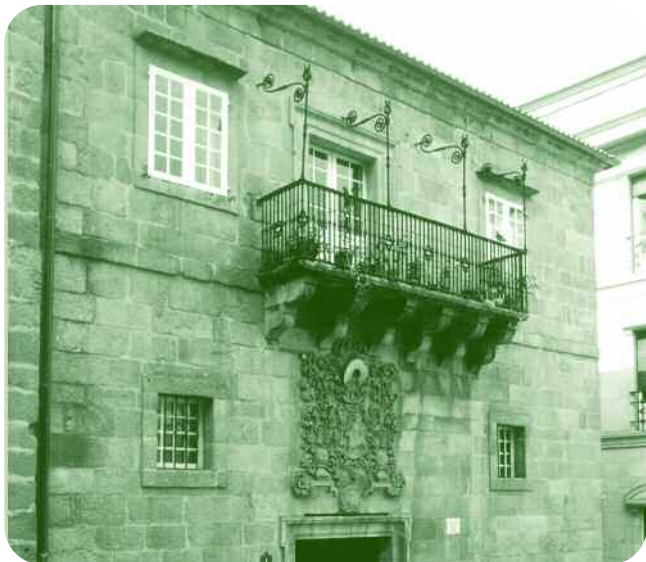
FACHADA DO EDIFICIO Á PRAZA MAIOR