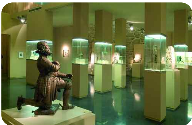
ESCOLMA DE ESCULTURA, SALA SAN FRANCISCO