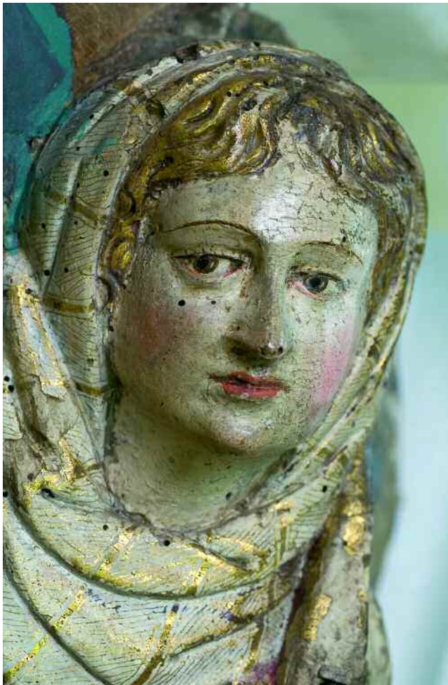
DETALLE DA VIRXE