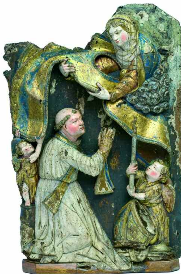
IMPOSICIÓN DA CASULA A SAN ILDEFONSO