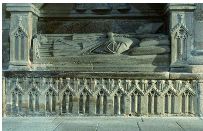
SEPOLCRO DO BISPO DON LORENZO. CATEDRAL DE OURENSE