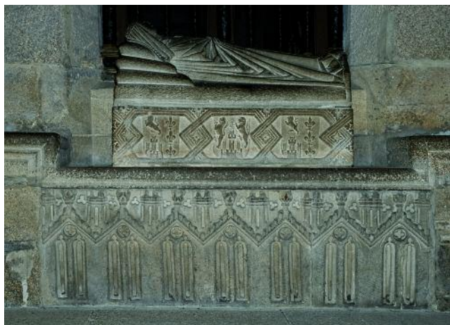
SEPULCRO DA INFANTINA. CATEDRAL DE OURENSE

ojival. Esta circunstancia, la de estar los de cada lado en la misma línea, medir unos y otros igual longitud y ser ésta la del coro, nos hacen suponer que serían estos sillares los que coronaban el cerramiento del antiguo, y que al construirse la nueva sillería se levantó sobre ellos el resto del muro hasta donde hoy alcanza por exigirlo así su mayor elevación”.