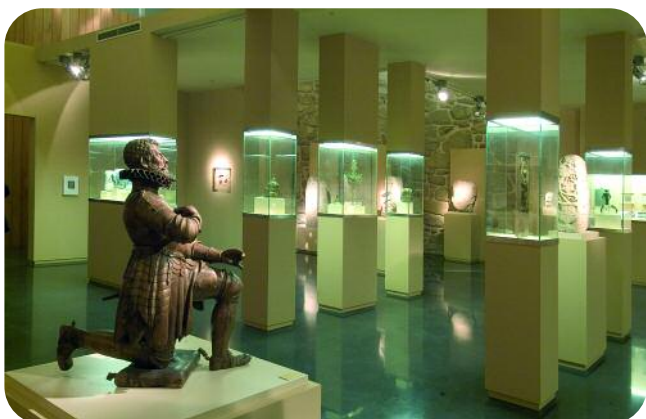
ESCOLMA DE ESCULTURA, SALA SAN FRANCISCO