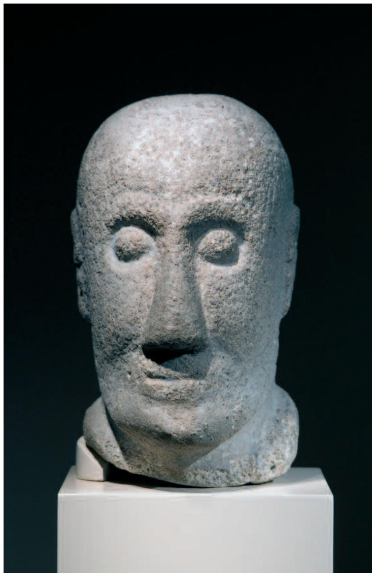
CABEZA DE GUERREIRO RUBIÁS, BANDE.