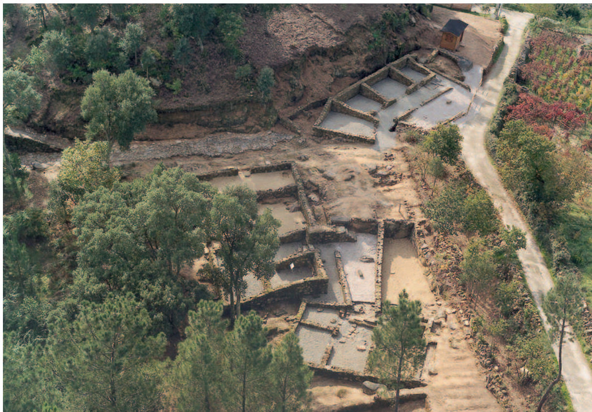
VISTA XERAL DA ÁREA ESCAVADA DO XACEMENTO