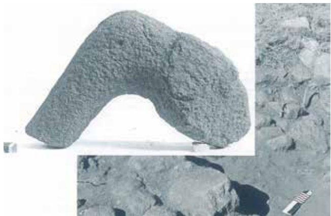
MONTE DO FACHO. AMARRADOIRO CON CABEZA ANIMAL.

por Luís Pericot García e Florentino López Cuevillas, durante a limpeza da muralla polo nacente do castro, na acrópole, onde se desenvolvera a totalidade do traballo arqueolóxico realizado nas campañas anteriores. Na campaña do vinte e nove, localízase a segunda muralla pertencente á terraza e varias construcións castrexas de planta circular e elíptica que achegan numeroso material: unha fíbula de bronce, e fibelas; unha punta de dardo e unha folla de coitelo do mesmo metal; cerámica castrexa e romana; pesos de rede e varios amarradoiros decorados. Estes, non moi lonxe de onde, nas campañas anteriores, aparecera un petróglifo gravado cunha serpe, símbolo, sen dúbida, dun culto ancestral.