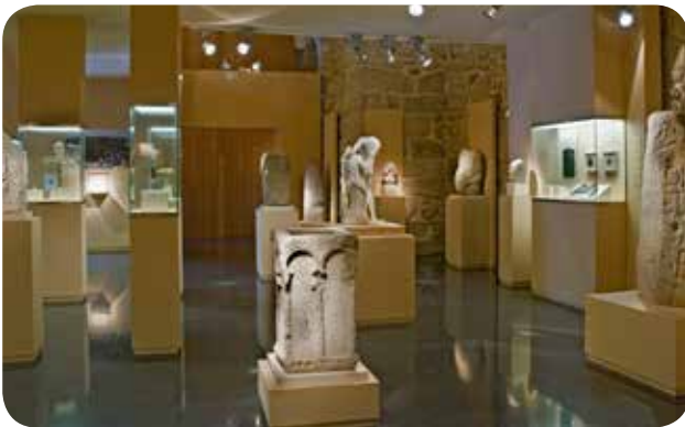
INTERIOR DA SALA DE ESCULTURA DO MUSEO ARQUEOLÓXICO PROVINCIAL