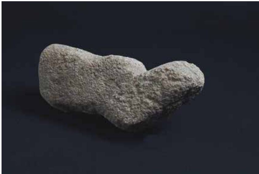
AMARRADOIRO CASTRO DE TROÑA