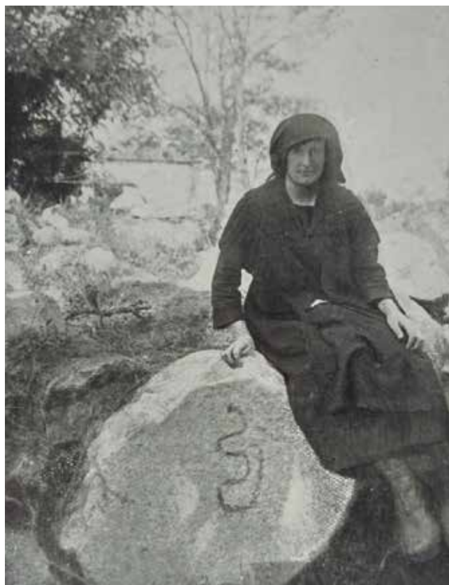
PETRÓGLIFO CON SERPE. FOTOGRAFÍA DE PERICOT E CUEVILLAS EN 1929

Tradicionalmente véñense interpretando como obxectos de uso meramente práctico e funcional. Así, parece afirmalo Calo Lourido e outros arqueólogos. Ven neles meras pezas funcionais destinadas a amarrar o gando, comparándoas con pezas actuais que, ata hai ben pouco, se atopaban nas cortes; outros investigadores pensan que