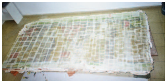
FIG 1: ENGASADO

Tras a humectación con auga desionizada das zonas con falta de recebo aplicouse o morteiro de recheo con espátula, a nivel da superficie da pintura. Obtida unha superficie saneada e regular era preciso protexer a pintura para poder realizar o "stacco", é dicir, a separación da última capa de morteiro sobre o que está realizada a pintura, da estrutura de ladrillo. A protección realizouse, con cola de coello e papel xaponés de 12 gramos de gramaxe. Procedeuse con moito coidado para garantir unha excelente adherencia. Repetiuse a mesma operación con gasa hidrófila (fig.1).