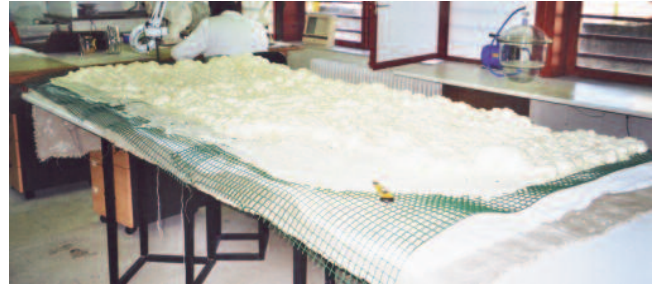
FIG 4: ELIMINACIÓN DA ESCUMA E DA REDE

Obtida unha superficie regular e homoxénea procedeuse á adhesión do stacco sobre un novo soporte. Optouse por un panel tipo sándwich co interior en fiño de abella,