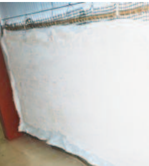
FIG 3: RETRO DA PINTURA TRALO "STACCO"

A separación de ambas as dúas partes realizouse entrando, polo perímetro, con ferros planos e longos, a xeito de espadas, buscando as zonas de debilidade entre morteiro e ladrillo.