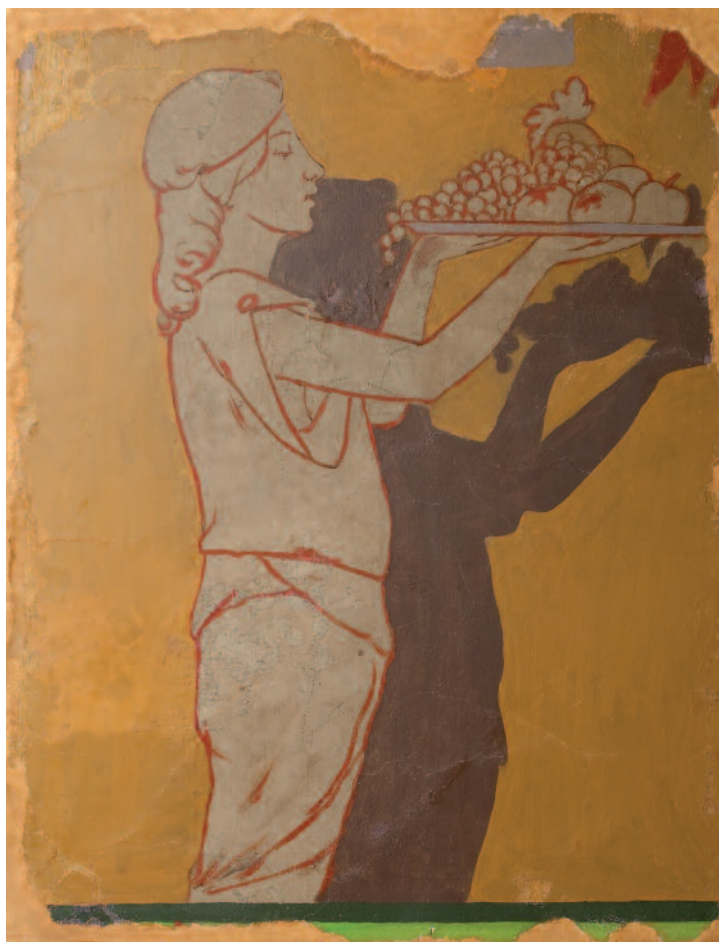
MURAL MODERNISTA JESÚS SORIA