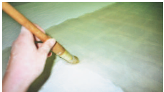
FIG 2: ADHESIÓN DE TELA DE PROTECCIÓN

Sobre esta dobre capa de protección colócase unha tea de algodón, de trama e urdidoira moi pechadas (fig.2), que servise de reforzo da pintura unha vez separada da estrutura de ladrillo e de capa de separación entre a obra e o sistema de soporte que será necesario realizar no anverso da obra.