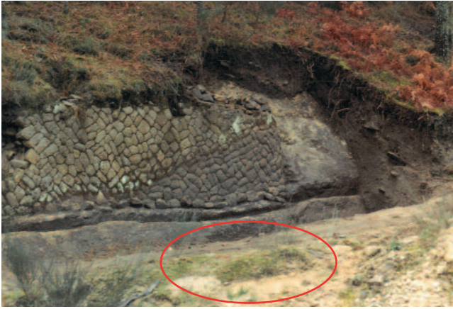
ZONA DE CONCENTRACIÓN DOS MOLDES