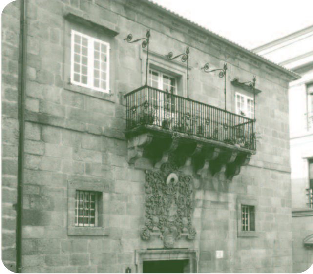
FACHADA DO EDIFICIO Á PRAZA MAIOR