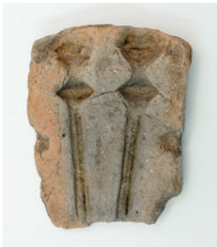
MOLDES DE ARXILA CASTRO COTO DO MOSTEIRO