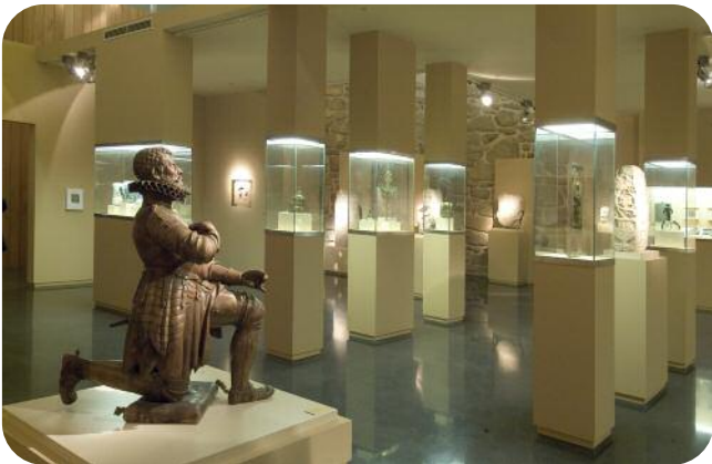
ESCOLMA DE ESCULTURA, SALA SAN FRANCISCO