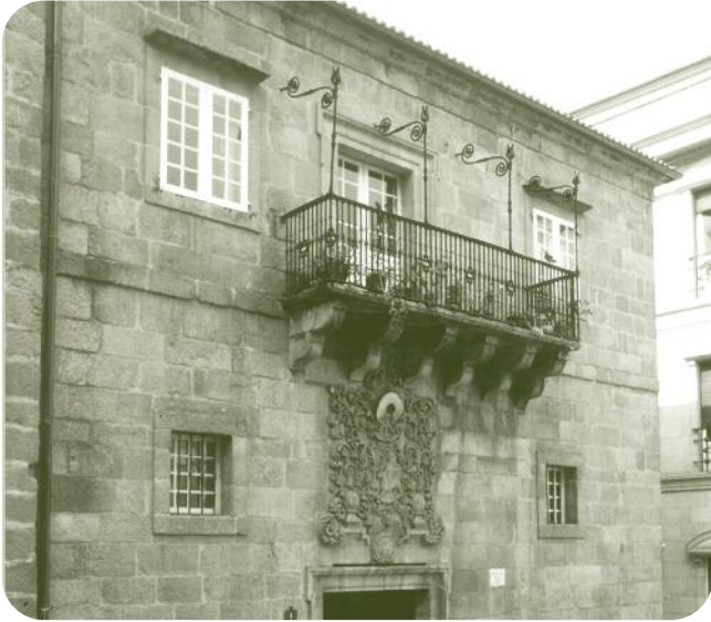
FACHADA DO EDIFICIO Á PRAZA MAIOR