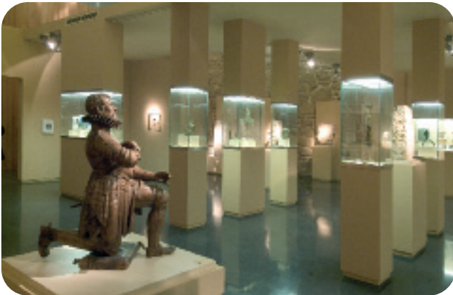
ESCOLMA DE ESCULTURA, SALA SAN FRANCISCO