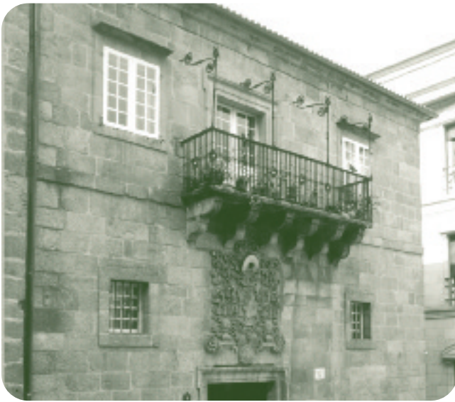
FACHADA DO EDIFICIO Á PRAZA MAIOR