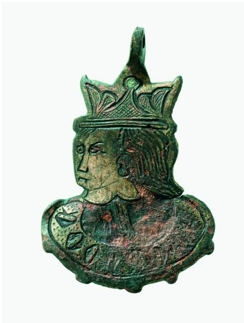
PINXANTE DE ARNÉS