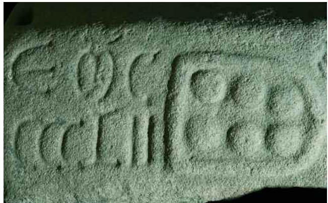
ERA DE 1452 E O ESCUDO MÁIS ANTIGUO DOS FEYJOO

Nun interrogatorio a diferentes testemuñas, datado no 26 de febreiro e 15 de marzo de 1481, sobre un