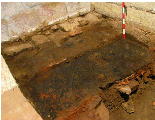
LUGAR ONDE APARECEU A PEZA

E non podemos substraernos ao feito de que a chegada deste material foi máis frecuente onde existía unha meirande receptividade ou, mesmo coñecemento, desa realidade: os ambientes cortesanos e urbanos, pois se trata de peza máis de salons e de