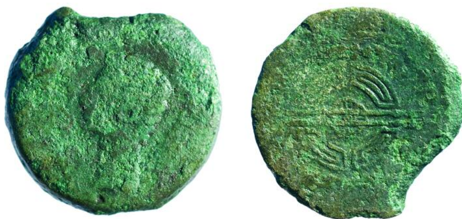
MOEDA DA CAETRA