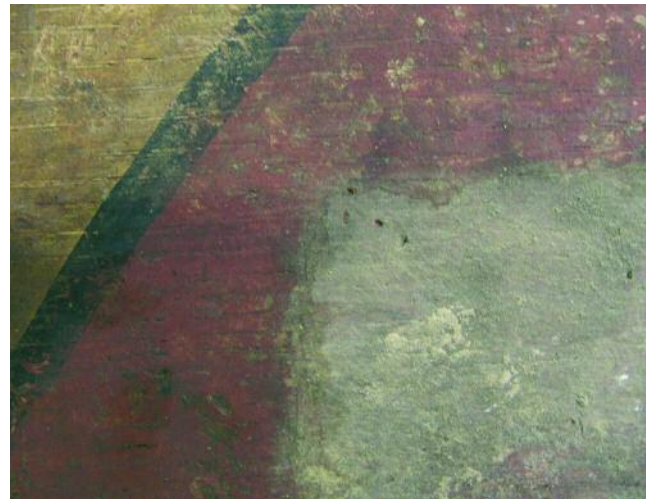
DETALLE DO PROCESO DE LIMPEZA DA TRASEIRA

Tras un primeiro exame visual da obra foi posible determina-la existencia dun repinte xeralizado da peza, así como a incorporación de elementos engadidos como as portas, de feitura