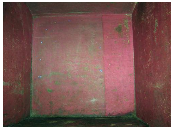
LIMPEZA DO INTERIOR