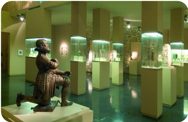
ESCOLMA DE ESCULTURA, SALA SAN FRANCISCO