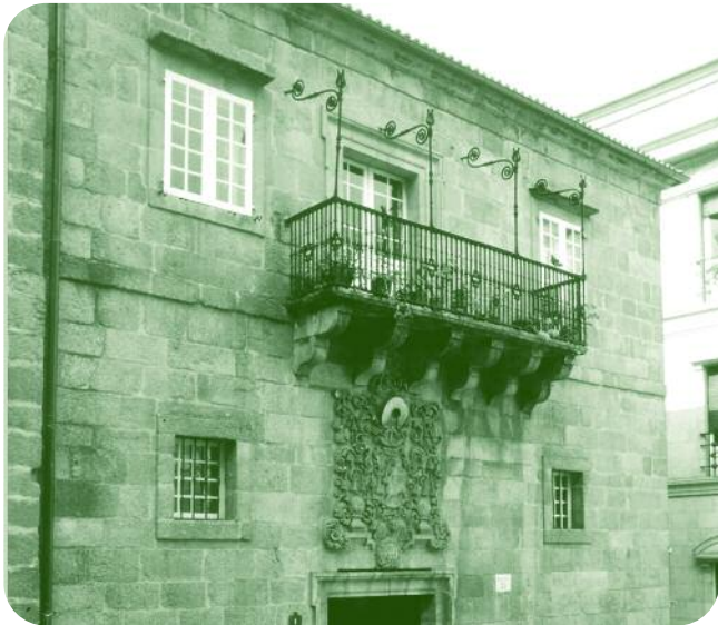
FACHADA DO EDIFICIO Á PRAZA MAIOR