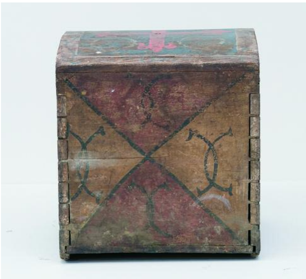
VISTA INICIAL DA TRASEIRA

En canto á restauración desta obra é necesario comezar polo estudo material da mesma. Trátase dun ben moble realizado na súa totalidade en madeira de castiñeiro e policromado.