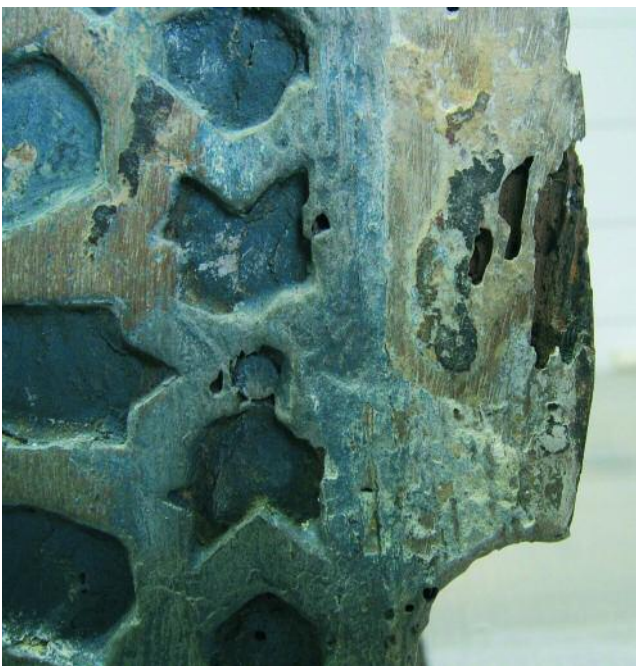
PROCESO DE ELIMINACIÓN DO REPINTE

Na policromía, a pintura orixinal é escasa e tan só permanece na traseira con numerosas faltas, pero que todavía permiten ver os motivos representados.