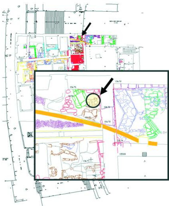
LOCALIZACIÓN DA ZONA DE APARICIÓN NO CONXUNTO DO PAZO BISPAL E DETALLE