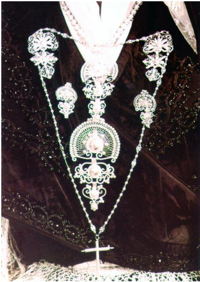
ADEREZO . ILUSTRACIÓN DO LIBRO EL TRAJE GALLEGO DE A. FRAGUAS