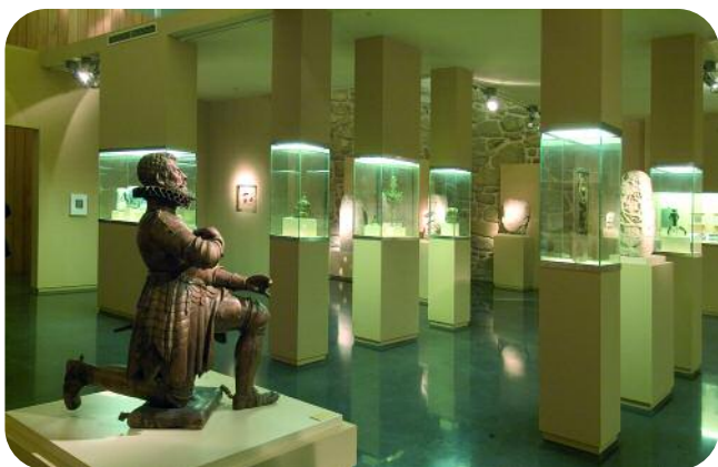
ESCOLMA DE ESCULTURA, SALA SAN FRANCISCO