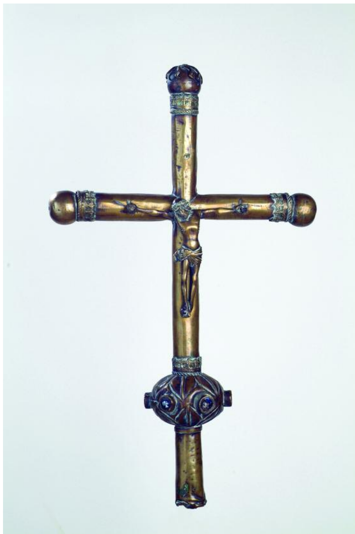
CRUZ PROCESIONAL CON ESMALTES