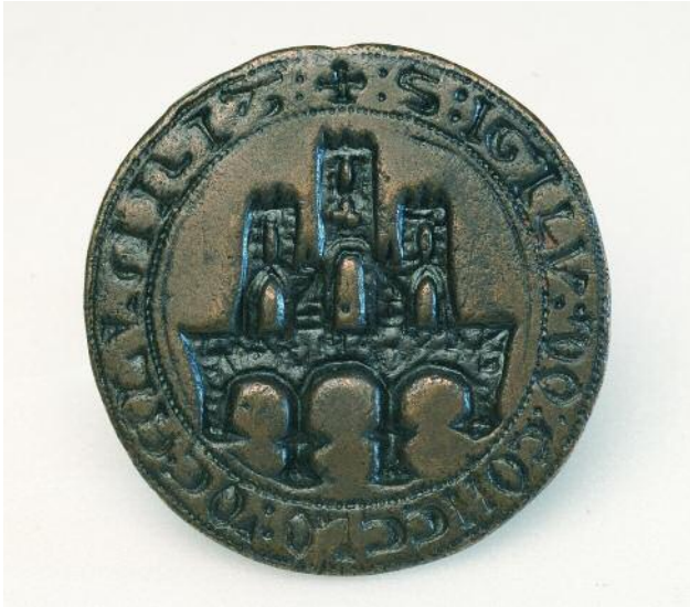
MATRIZ, VISTA INVERTIDA