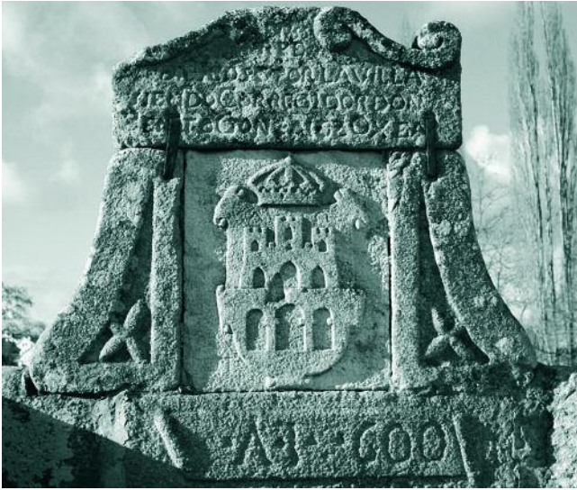
ESCUDO DA PONTE DE VILANOVA. 1600