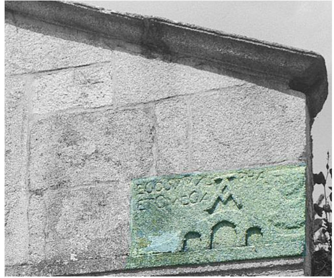
DETALLE DA FONTE DE SAN ISIDRO. 1667

outros elementos públicos como fontes e depósitos de auga –caso que documentamos anos máis tarde na propia vila de Allariz na fonte de San Isidro, na que figura o selo do concello xa lixeiramente modificado–, ou nas pontes –como se ollá, tamén en Allariz, na Ponte de Vilanova e na de San Isidro–.