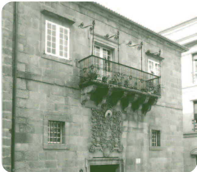
FACHADA DO EDIFICIO Á PRAZA MAIOR