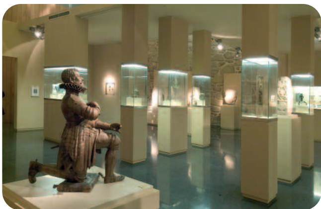
ESCOLMA DE ESCULTURA, SALA SAN FRANCISCO