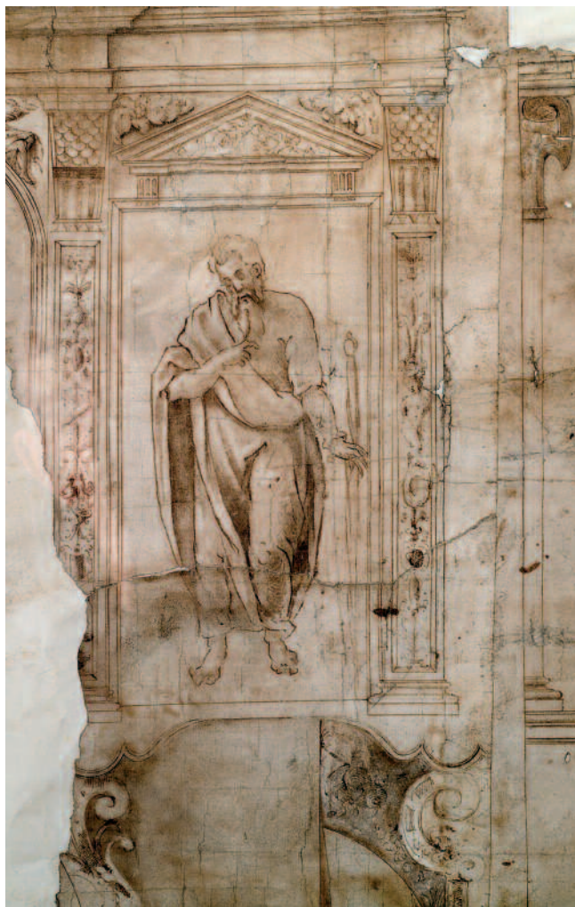
FRAGMENTO DA TRAZA DE CORO DA CATEDRAL DE OURENSE