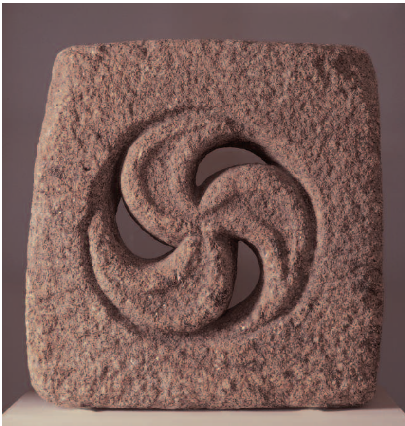
TRÍSCELE CALADO CASTROMAO