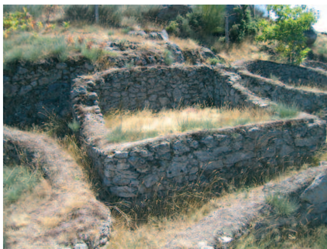
ESTRUCTURA III DE GARCÍA ROLLÁN Á QUE SE ATRIBÚE A PROCEDENCIA DO TRÍSCELE