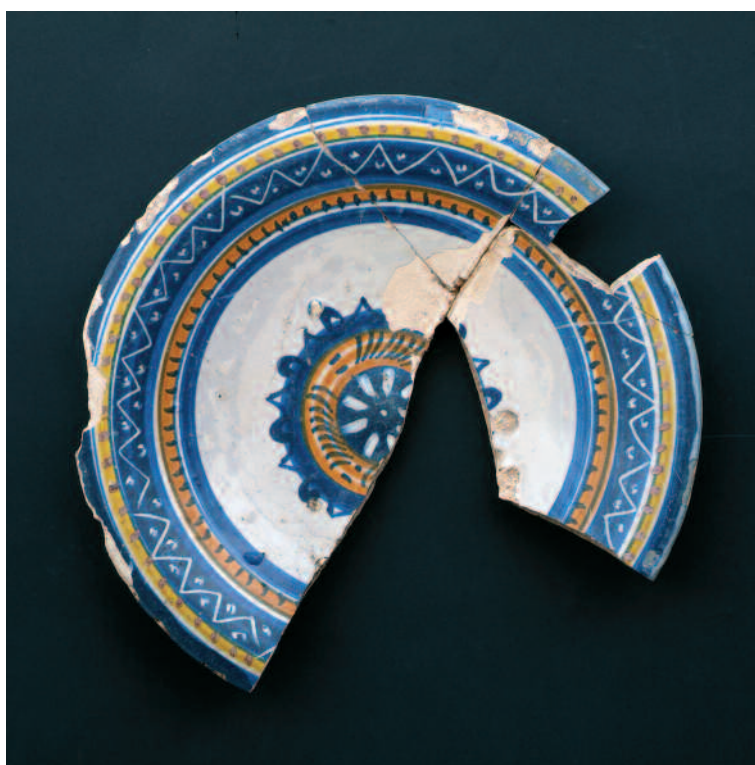
PRATO DE MONTELUPO TOSCANA. ITALIA