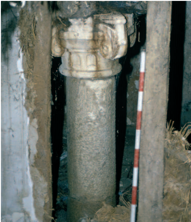
CAPITEL "ALCARREÑO" IN SITU

hoxe, infelizmente, so se conserva unha mínima testemuña in situ .