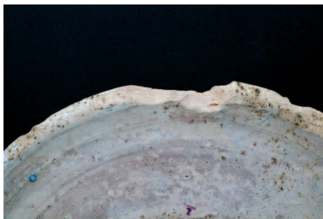
VEDRÍO BRANCO-GRIS LEITOSO NA PARTE POSTERIOR DO PRATO