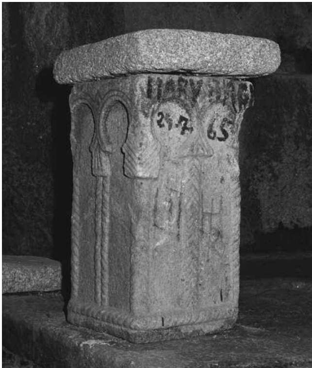
ARA COS DETERIOROS