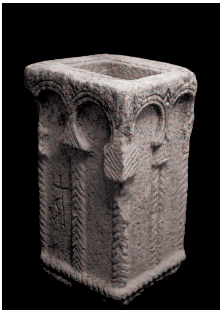
ARA SAN PEDRO DE ROCAS