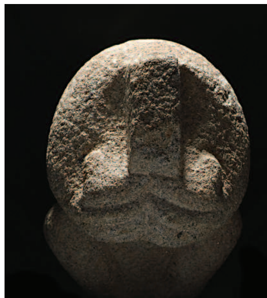
DETALLE DA PARTE BAIXA DA FIGURA

O lugar onde se localizou ofrece tamén o seu interese, pois, como vai dito, a súa aparición tivo lugar no alicerce da casa da que X. Lorenzo estudou a transformación e que, por outros achados, configura unha zona de particular importancia dentro do poboado. Efectivamente, neste sector da vertente norte da plataforma baixa do castro, coinciden un grupo de estruturas constructivas, asociadas con un pavimento exterior laxeado que as pon en relación, e onde apareceron pezas decoradas, algúns vans nas paredes, restos de fiestras caladas, a tabula hospitalis , un acubillo monetario, etc., que nos fan sospeitar que deberon ter un certo carácter público, como ten sulinado recentemente Breogán Muñíz ao estudar a tabula hospitalis .