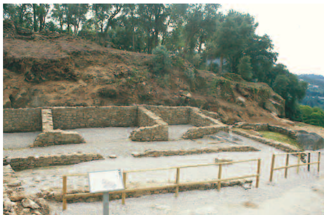
CONXUNTO ARQUEOLÓXICO-NATURAL DE SANTOMÉ. SECTOR II