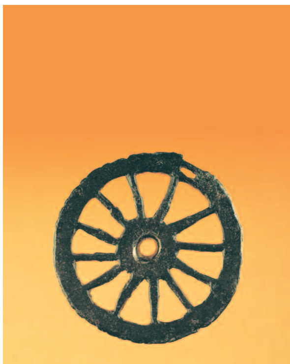
CAMA DE BOCADO DE CABALO. SANTOMÉ