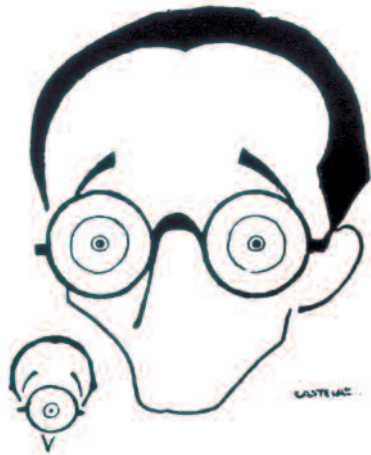
VICENTE RISCO, VISTO POR CASTELAO