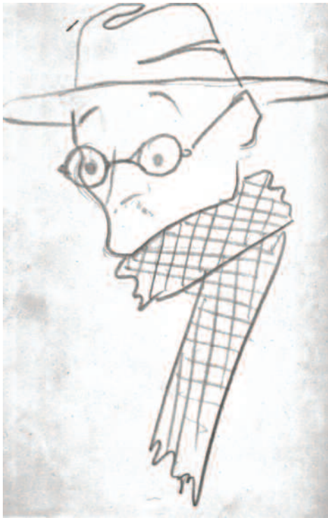
CARICATURA DE VICENTE RISCO, VISTO POR CASTELAO

Pontevedra. Fai varias exposicións e publica as súas obras en revistas e xornais: Vida Gallega , Mi Tierra , El Liberal , El Parlamentario , El Sol ou no semanario de Rianxo El Barbero Municipal , onde retrataba aos políticos e caciques locais. Pero os contidos destas primeiras obras acostuman a ser política e socialmente neutros, de estética decorativista e dun humorismo costumista. O ingreso nas Irmandades da Fala supón nel a conversión ao nacionalismo e unha evolución artística. En 1920 nace en Ourense a revista Nós sendo Vicente Risco o director literario e Castelao o director artístico. Con motivo da exposición dos debuxos do Álbum Nós pronuncia a conferencia Humorismo. Dibuxo humorístico. Caricatura , publicada na revista A Nosa Terra , e que escomeza decindo: “Chámase decote caricatura a todo dibuxo humorístico; mais eu teño á caricatura por cousa moi diferente do que é o dibuxo humorístico. Cicais poida serse caricaturista sen ser humorista. A caricatura é un xeito novo de deseño: un Arte que nasceu en Munich á medeados do século derradeiro. En troques pode serse debuxante humorista sen acollerse á técnica nova nin tan siquiera ó impresionismo da liña...”. Defínea como “a abreviatura do dibuxo” pois basándose na simplicidade, escolle os rasgos esencialmente expresivos e suprime todo o auxiliar e accesorio. “Unha caricatura debe facerse despreciando isa beleza convencional que ten por defeutos moitos elemen-