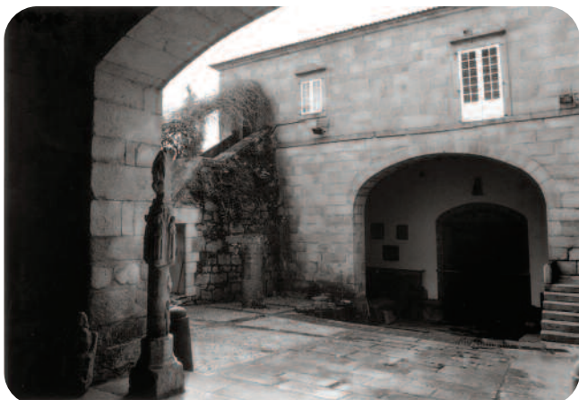
PATIO DIANTEIRO TRALA REFORMA DE 1960