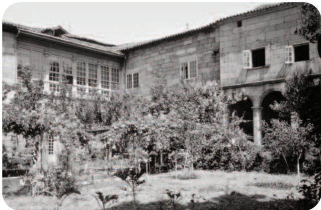
O XARDÍN E O EDIFICIO ANTES DA REFORMA DE 1960