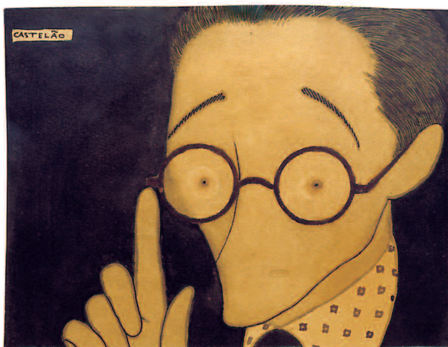
CARICATURA DE RISCO POR CASTELAO