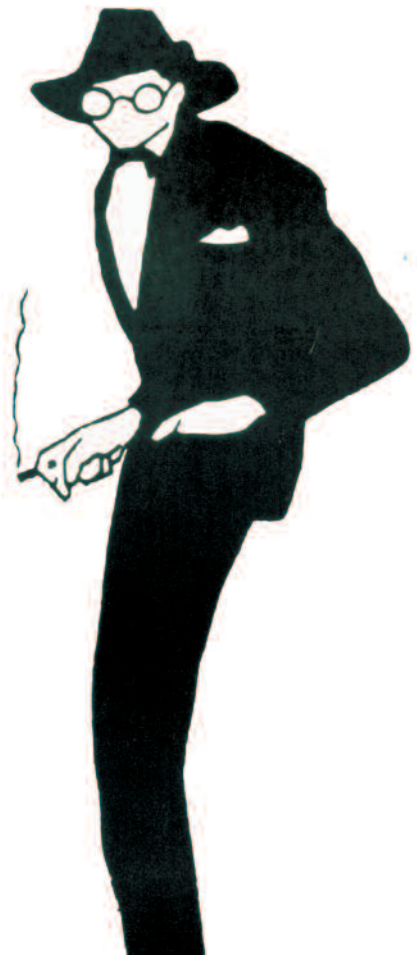
AUTOCARICATURA. CASTELAO. 1917

ALFONSO DANIEL MANUEL RODRÍGUEZ CASTELAO (CABO DA VILA, RIANXO, A CORUÑA, 1886 - BOS AIRES, 1950)