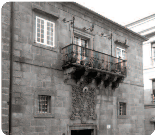
FACHADA DO EDIFICIO Á PRAZA MAIOR