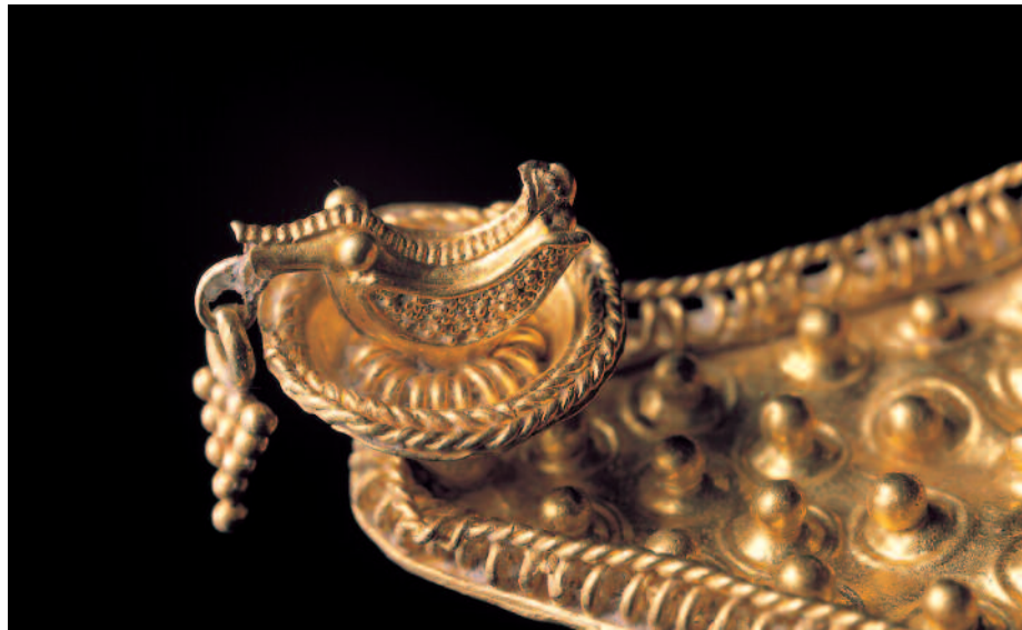
DETALLE DA ARRACADA CO «PATIÑO».