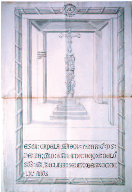
HUMILLADOIRO DE SAN FRANCISCO DE OURENSE. DEBUXO DO SÉCULO XVIII. ANVERSO