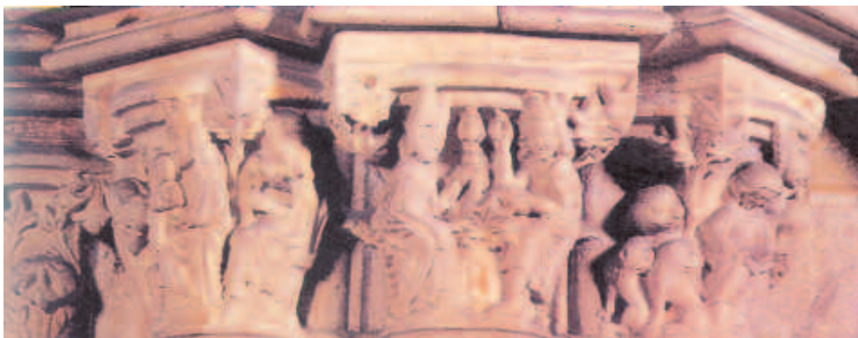
CAPITEIS DA "CLAUSTRA NOVA". CATEDRAL DE OURENSE