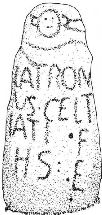
DEBUXO DA FIGURA PARTE DIANTEIRA.

traducir unha forma indíxena, aparentemente sen valorar a calificación infamante que o nome latino pode ter, pero que resulta moi suxerente en relación coas prácticas que os xeógrafos grecorromanos lles atribúen ás xentes do NW. penínsular, ou incluso ós lusitanos, e que poden encubrir elementos relacionados coa organización social interna das poboacións do territorio.