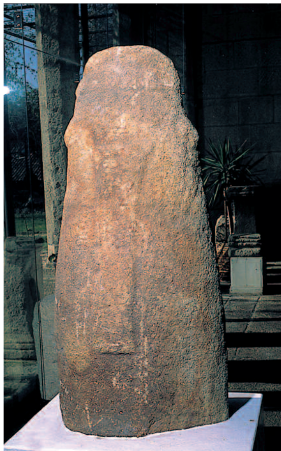
PARTE POSTERIOR DA ESTELA FUNERARIA.