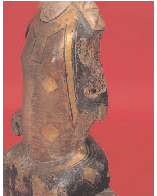
DETALLE DA POLICROMÍA DO MANTO.

A iconografía, moi tradicional, responde a modelos románicos de influencia bizantina, onde predomina a presenza de María como Theotocos, sempre en relación directa coa figura do Salvador, o seu fillo, ó que sostén en brazos, sen manter con Él unha relación maternal, amosándoo ó mundo. María represéntase, así, como a muller que fai posible o milagre da Redención, e como tal se amosa, con toda a dignidade, situada nun trono, hierática, frontal e intemporal. Empregando, para isto, unha composición pechada en volúmenes xeométricos, reforzada polo emprego da liña recta.