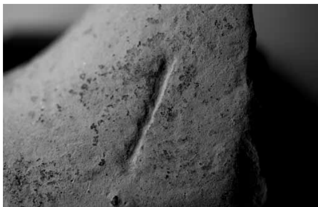
FOTOGRAFÍA DO DETALLE DA PALMA.

superficie externa está, a miúdo, cuberta por unha capa de fragmentos de area, para permitir esmagar os alimentos. Orixinarios dunha área da Italia central, próxima a Roma, vénselle asignando unha cronoloxía que abrangue desde a época republicana ata finais do século I d. C., momento no que son substituídos polos morteiros Dramont 2.