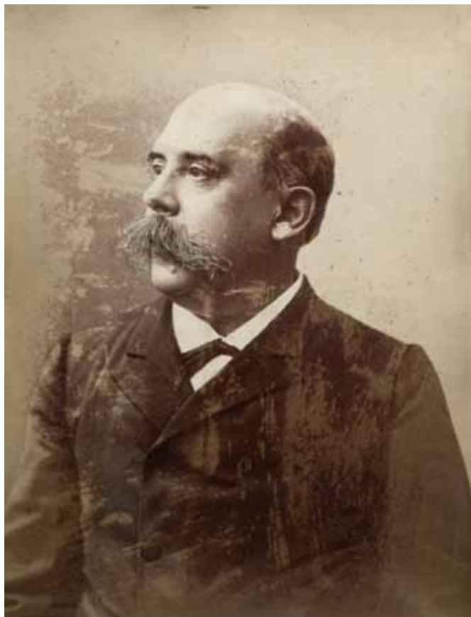
FOTOGRAFÍA RETRATO DE EMILIO CASTELAR