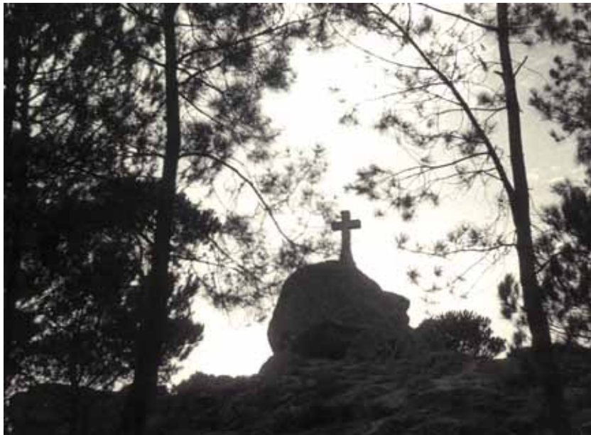
FOTOGRAFÍA CRUZ DE MONTEALEGRE