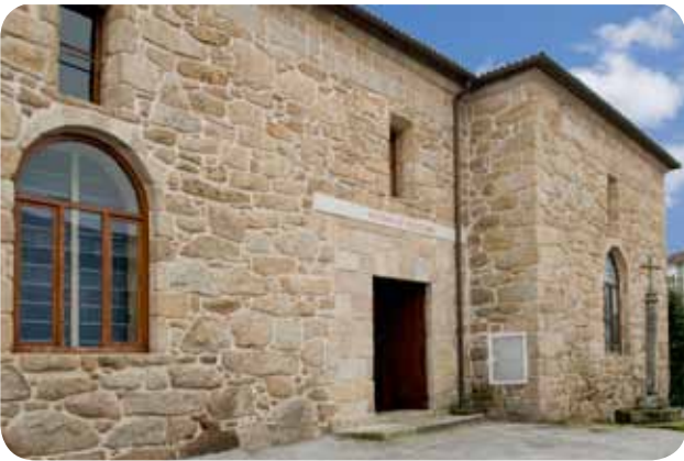
ENTRADA Á SALA DE ESCULTURA DO MUSEO ARQUEOLÓXICO PROVINCIAL SITUADA AO LADO DO CLAUSTRO DE SAN FRANCISCO