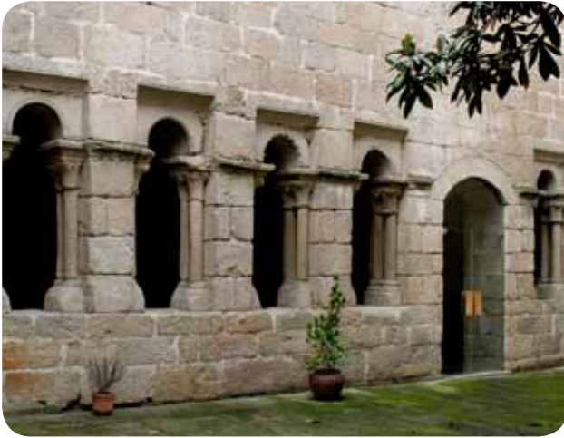
CLAUSTRO DO PATIO DO MUSEO ARQUEOLÓXICO NA SÚA SEDE DA PRAZA MAIOR