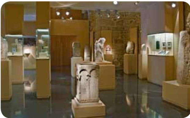
INTERIOR DA SALA DE ESCULTURA DO MUSEO ARQUEOLÓXICO PROVINCIAL