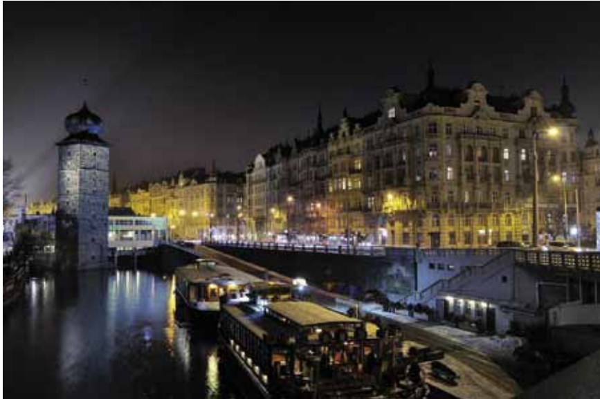
VISTA ACTUAL DA TORRE DA AUGA DE PRAGA.