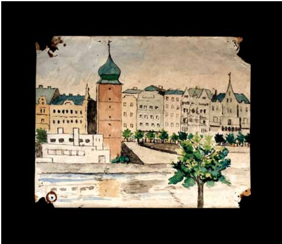
VISTA DE PRAGA. VICENTE RISCO