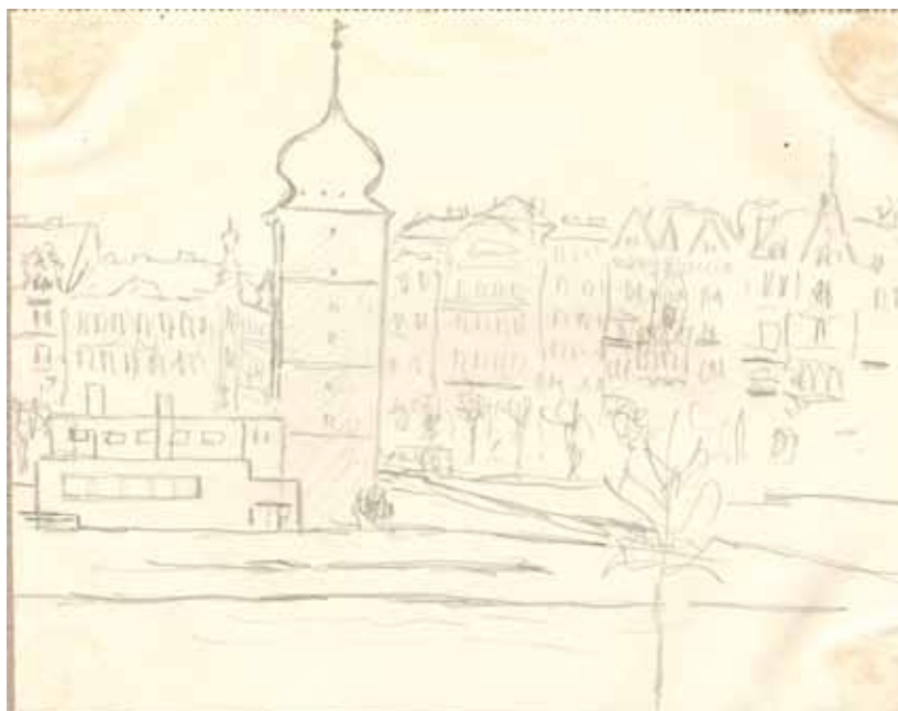
BOSQUEXO DA PAISAXE DE PRAGA. LAPIS SOBRE PAPEL. FUNDACIÓN VICENTE RISCO