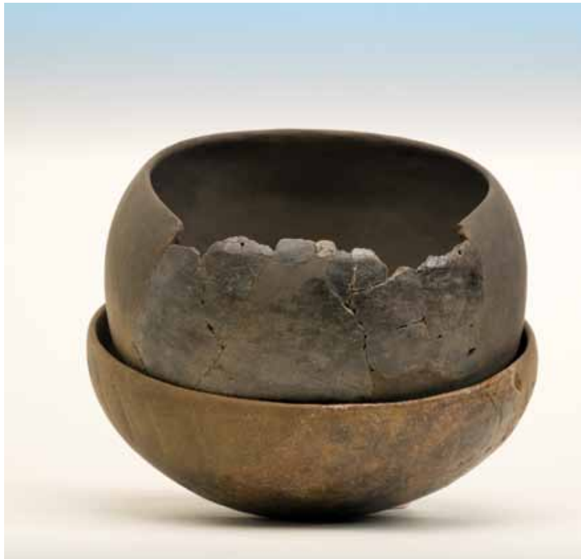
A OFRENDA FUNDACIONAL DO TÚMULO M5 DE OUTEIRO DE CAVALADRE (MUÍÑOS, OURENSE)