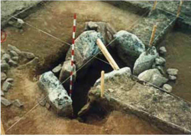
MONUMENTO CON CISTA RECTANGULAR ONDE SE ATOPARON OS DOUS RECIPIENTES CERÁMICOS E A PUNTA DE FRECHA