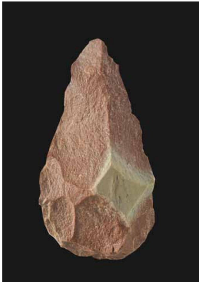
BIFACE TRASALBA, AMOEIRO