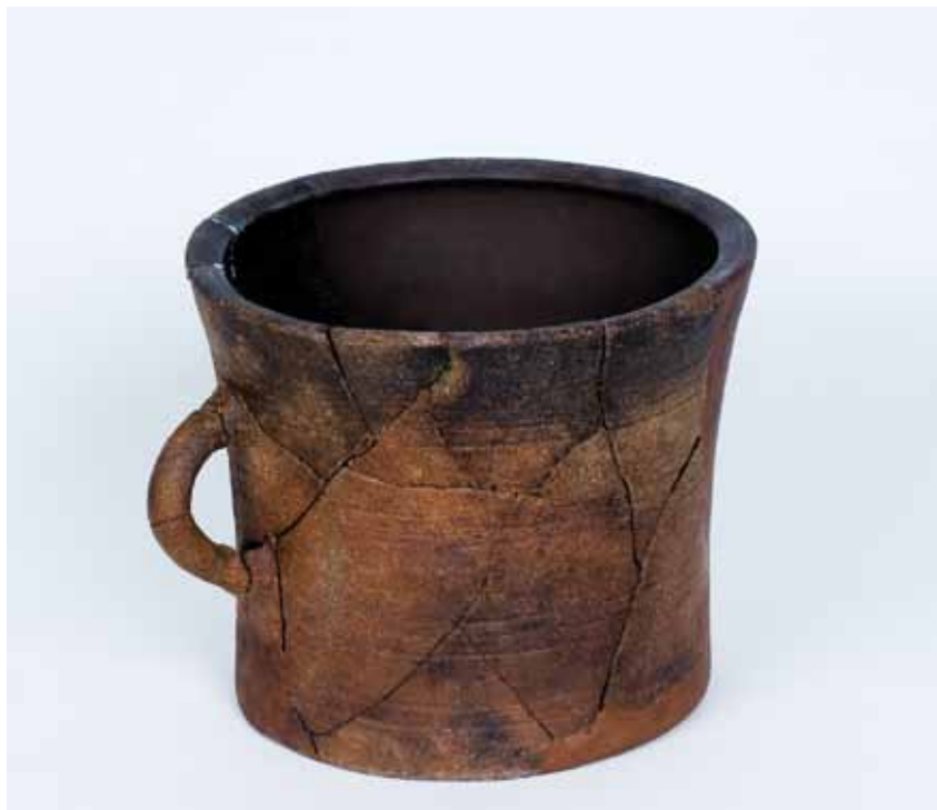
VASO CILÍNDRICO CASTRO DE SAN CIBRAO DE LAS