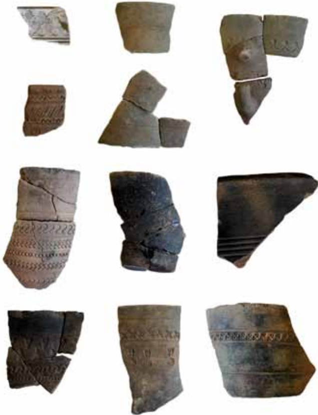
REPERTORIO DECORATIVO DE VASOS CILÍNDRICOS

similitudes na composición petrográfica e química que suxiren semellanzas no tipo de materias primas empregadas –arxilas non calcarias e desengordurantes graníticos–, así como nas técnicas de manufactura. Porén, as diferentes petrográficas e químicas permitiron identificar varios grupos de pastas. Tras considerar a xeoloxía rexional, cada grupo é compatible cunha produción local. Polo tanto, aínda que podería ser unha forma orixinaria de San Cibrao de Las, cada xacemento fabricaría a súa propia versión, engadindo en moitas ocasións elementos diferenciadores, como decoracións propias de cada lugar.