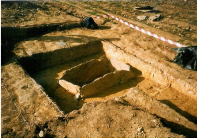
FOTOGRAFÍA DE RAMÓN BOGA MOSCOSO, 1995