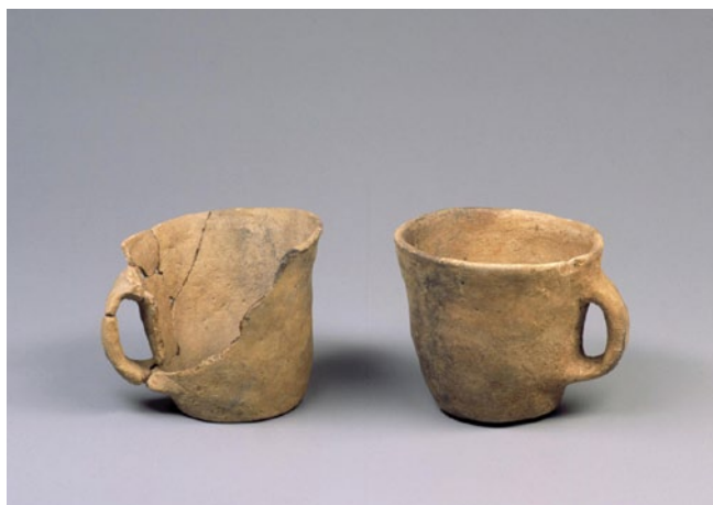
VASOS TRONCOCÓNICOS. O CHEDEIRO, A PEDROSA

lixeiramente máis anchos que o corpo central da asa. Os catro vasos foron realizados á man mediante a técnica de urdido a base de rolos, e a súa textura non é excesivamente compacta. Como desgrasante utilizouse un gran pequeno e mica distribuídos de xeito irregular por toda a mestura arxilosa. A cor superficial exterior é marrón clara cun rematado brunido medio, sendo máis rudo no interior. A fractura da pasta mostra unha cocción oxidante, a unha temperatura que oscila entre os 500° e os 1100°, a parte exterior é avermellada e a interior negruzca. En canto á súa forma, como de campá, podémola rastrexar na necrópole do Chedeiro, A Pedrosa, ou no gran vaso aparecido no xacemento próximo de Santa Marta de Lucenza tamén no sur de Ourense, pero sobre todo encóntranse recipientes semellantes no norte de Portugal, como os achados na cista de Meixedo, Gorgolão, Corvihlo, Touredo, Lomba de Coimbró, ou a mámoa de Terranha. Ata o momento este tipo de vasos non aparecen asociados a restos metálicos, non obstante nunca aparecen só, soen ir acompañados doutros vasos semellantes, formando parellas, como é o caso desta cista, ou aparecer con outras formas diferentes. Polo que parece, as súas características formais circunscríbense a unha área xeográfica concreta, que comprende todo o sur da provincia de Ourense e o norte de Portugal, circunscríbíndose a unha área concreta.