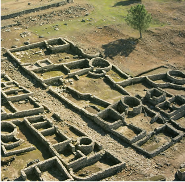
VISTA XERAL DA VIVENDA 14, AO SUR DA RÚA PRINCIPAL