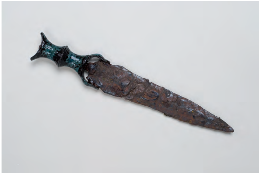
PUÑAL DE ANTENAS CASTRO DE SAN CIBRAO DE LAS