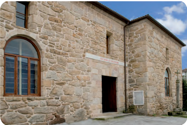
ENTRADA Á SALA DE ESCULTURA DO MUSEO ARQUEOLÓXICO PROVINCIAL SITUADA AO LADO DO CLAUSTRO DE SAN FRANCISCO