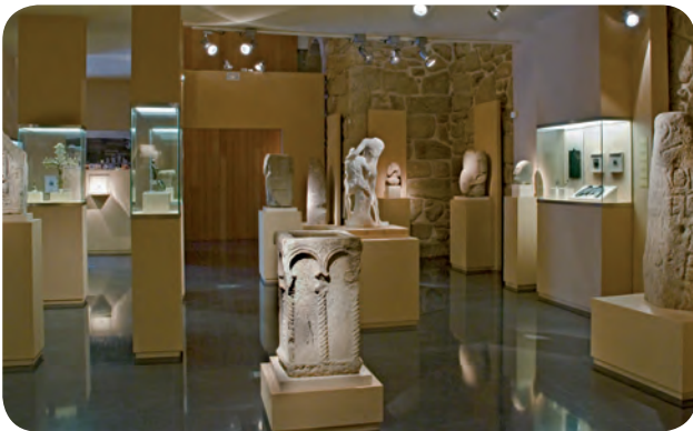
INTERIOR DA SALA DE ESCULTURA DO MUSEO ARQUEOLÓXICO PROVINCIAL