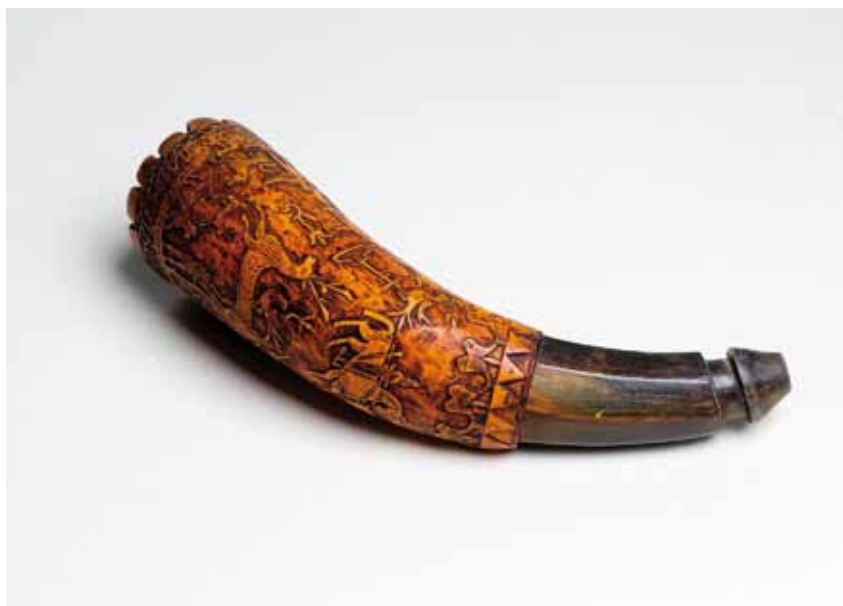
FRASCO DE PÓLVORA