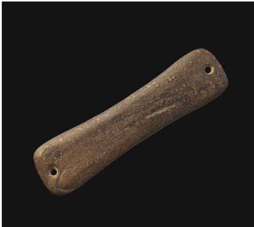
BRAZAL DE ARQUEIRO COTO DO BRIGUEIRO (CARBALLEDA DE AVIA)