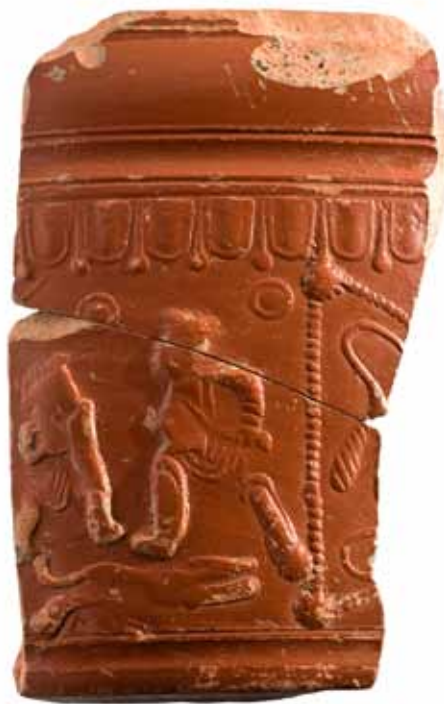
SIGILLATA SUDGÁLICA DECORADA CONXUNTO ARQUEOLÓXICO-NATURAL DE SANTOMÉ