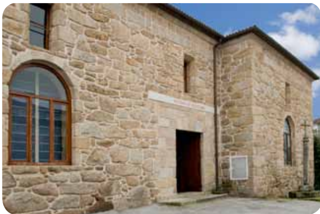
ENTRADA Á SALA DE ESCULTURA DO MUSEO ARQUEOLÓXICO PROVINCIAL SITUADA AO LADO DO CLAUSTRO DE SAN FRANCISCO