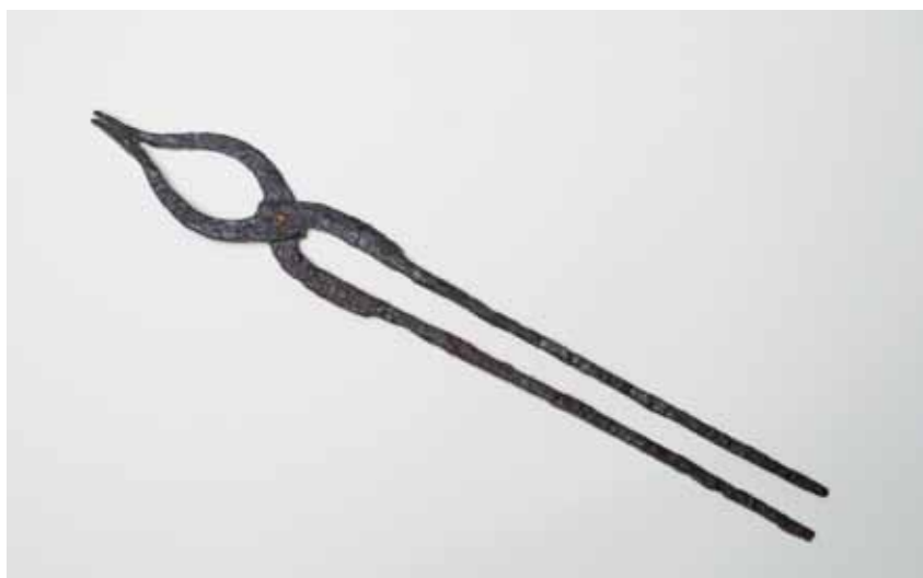
TENACES CASTRO DA SACEDA