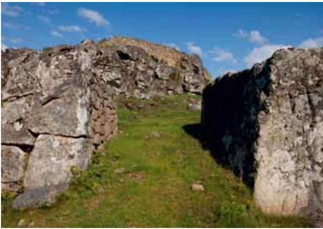
PORTA CICLÓPEA DE ACCESO AO RECINTO INTERMEDIO.