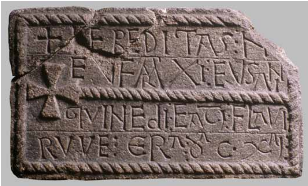
LÁPIDA DE SAN PEDRO DE ROCAS