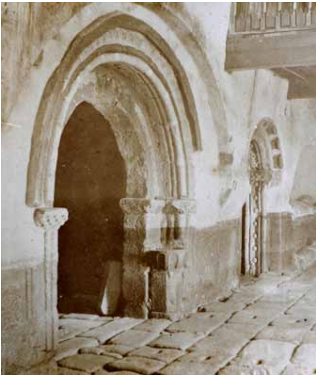
INTERIOR DA IGREXA DE SAN PEDRO DE ROCAS. ÁLBUM DA COMISIÓN DE MONUMENTOS DE OURENSE, 1895