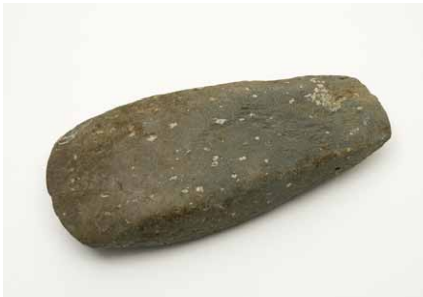
UN MACHADO PUÍDO DA MOTA PEQUENA DE MONTE ALBÁN RAIRIZ DE VEIGA, OURENSE