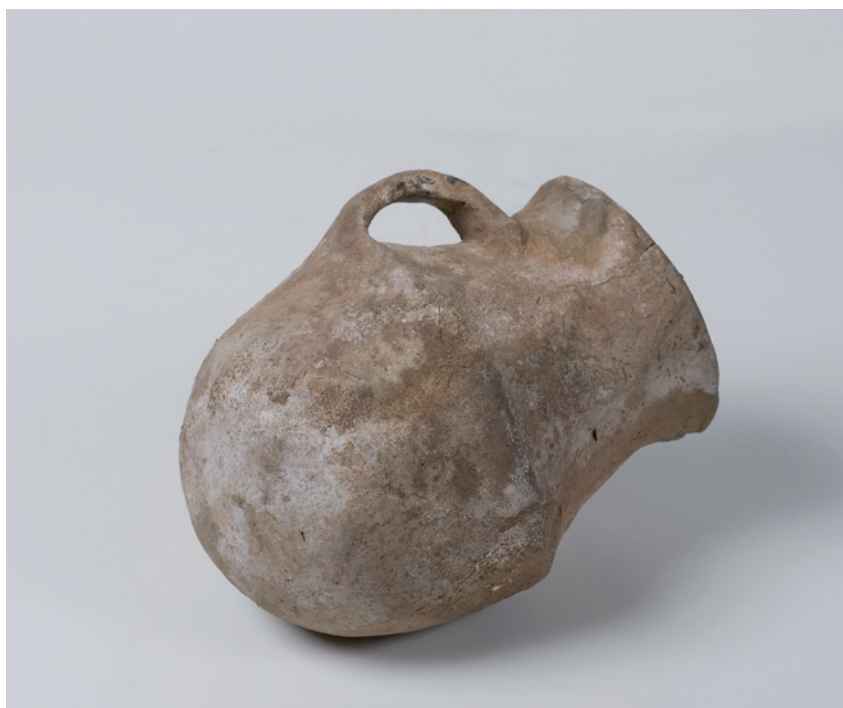
VASO DA IDADE DO BRONCE DE PARDOLLÁN, VALDEORRAS