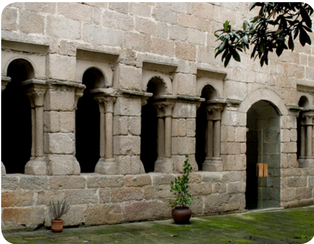
CLAUSTRO DO PATIO DO MUSEO ARQUEOLÓXICO NA SÚA SEDE DA PRAZA MAIOR