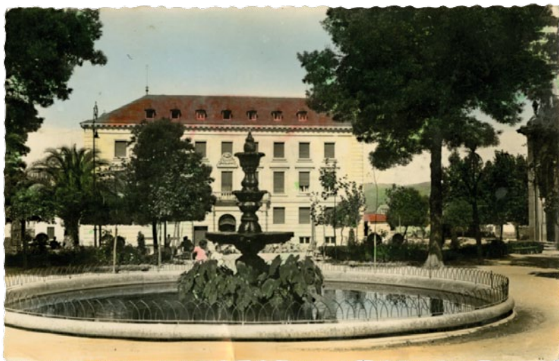
FOTOGRAFÍA PARQUE DE SAN LÁZARO