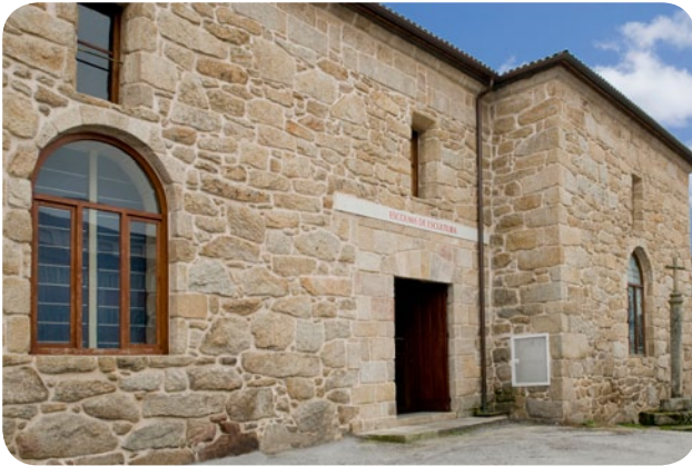
ENTRADA Á SALA DE ESCULTURA DO MUSEO ARQUEOLÓXICO PROVINCIAL SITUADA AO LADO DO CLAUSTRO DE SAN FRANCISCO