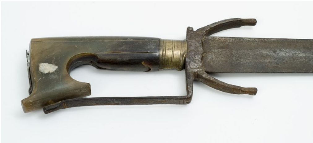
ESPADA NIMCHA. EMPUÑADURA