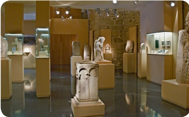
INTERIOR DA SALA DE ESCULTURA DO MUSEO ARQUEOLÓXICO PROVINCIAL