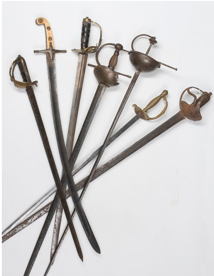
ESPADAS MODERNAS SÉCULOS XVII AO XX