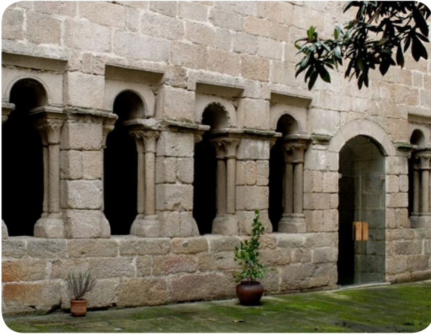
CLAUSTRO DO PATIO DO MUSEO ARQUEOLÓXICO NA SÚA SEDE DA PRAZA MAIOR